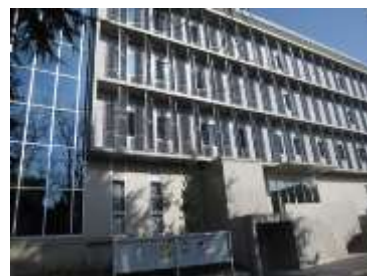
西館外観。2~4階にずらりと図書や雑誌が並ぶことになります。

西館3・4階には、今年度中に電動集密書架を設置し、書庫内図書や雑誌のバックナンバーなどを並べる予定です。また、ラーニング・commonsや児童書コーナー、企画展示室などの家具・備品も整備する予定です。皆様にはご不便をおかけすることもあります。新しい図書館にどうぞご期待ください！