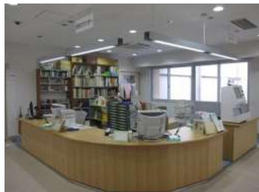
新しいカウンターの様子

すっかりあたしくなった図書館ですが、まだまだ手を入れねばならないところも残っています。机やイスも、すでにあたらしくしたのものもありますが、これからも順次更新していく予定です。本学の図書館が知の拠点としてさらに発展していくよう、力を尽くしていこうと思います。このあたらしい図書館が、みなさんにとって、あらたな興味、あらたな自分との出会いの場となることを期待しつつ。